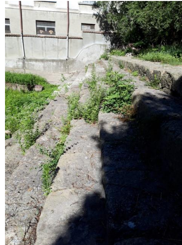
Vegetazione che cresce sulla traversa