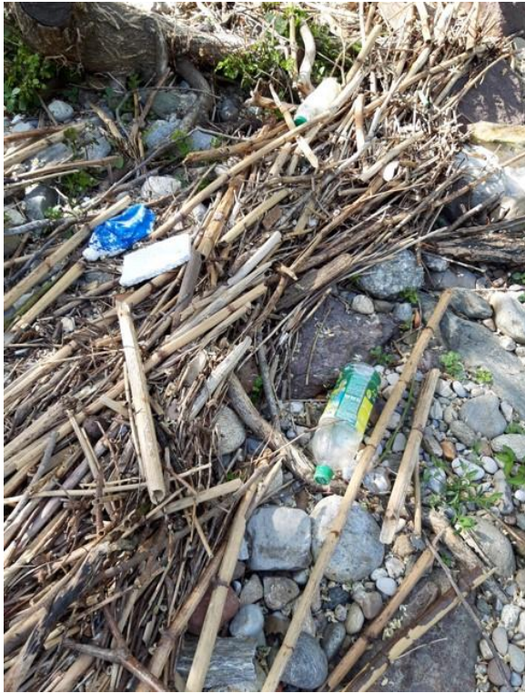
Rifiuti, rami, detriti portati dal fiume