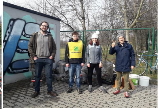
Figura 3 – i nostri volontari alla Boscherona