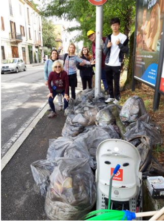
Figura 6 - Ciclabile Villoresi - via Cavallotti

Mattinata di pulizie del canale Villoresi, finanziato dal Comune di Monza. Intervenute anche le GEV di Monza. Grande partecipazione degli studenti dell'International School of Monza. In tutto circa 30 volontari e 200 kg, oltre ad un bidone grosso di sole bottiglie di vetro (circa 300 vuoti, pari a 90 kg).