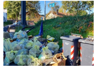
Figura 19 - Bottino enorme!