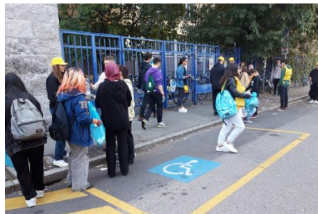
Figura 3 - Hensemberger Plogging