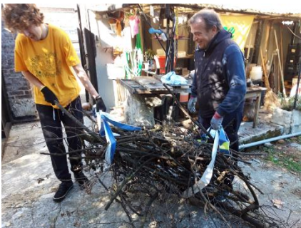
Figura 9 - Raccolta ramaglie all'Oasi di Monza

Mattinata di pulizie all'Oasi di Monza, finanziata dal Parco Valle Lambro. I partecipanti sono stati accolti dai nostri volontari e accompagnati a visitare l'Oasi. Successivamente ci si è dedicati alla raccolta dei rifiuti portati dalla corrente del Lambro e delle ramaglie che erano state accatastate durante una precedente manutenzione del verde. Hanno partecipato anche alcuni rappresentanti del gruppo CorroColGuanto.