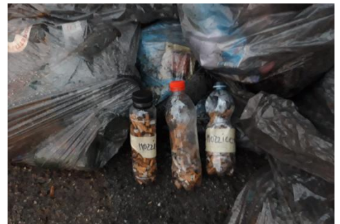
Figura 16 - Raccolta rifiuti e sacchi