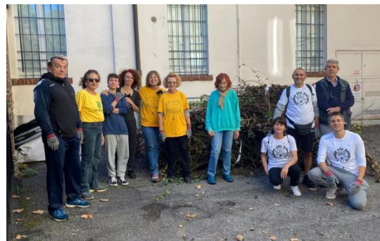
Figura 10 - Fine lavori all'Oasi di Monza