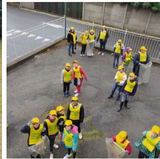
Figura 20 - Puliamo il Mondo 2022 - Scuole di Brugherio