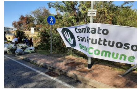
Figura 13 - Assieme al Comitato San Fruttuoso Bene Comune