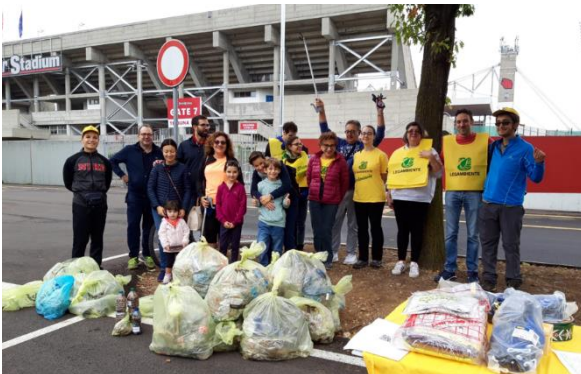
Figura 4 - Stadio di Monza

Circa 80 kg con una ventina di volontari.