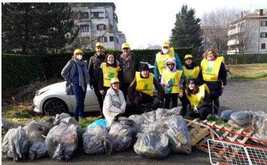
Figura 1 - Via Massaua

Circa 500 kg di rifiuti raccolti con 31 volontari