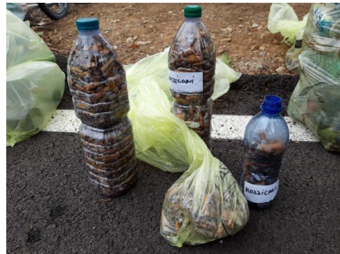
Figura 5 - Mozziconi del piazzale dello Stadio