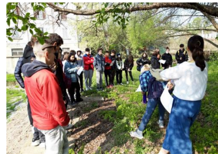
Figura 2 - Hensemberger OASI

Monza, 6 dicembre 2022 - Maddalena Viola