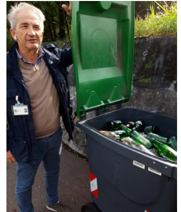
Figura 8 - Tante bottiglie di vetro