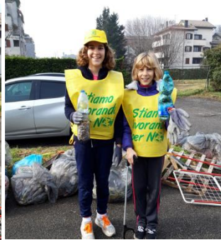
Figura 2 - Bambine all'opera