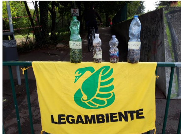
Figura 7 - Mozziconi, mozziconi, mozziconi