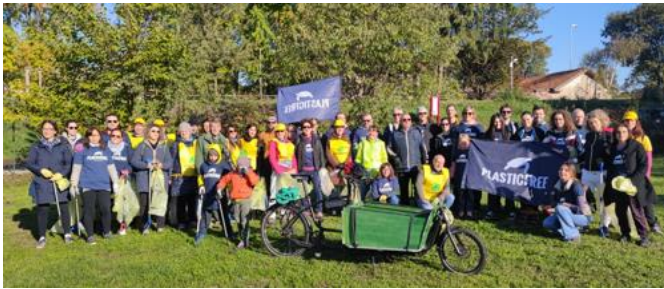
Figura 17 - Via Buonarroti... si parte!