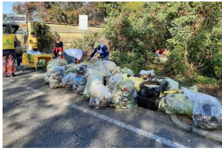
Figura 12 - Via Stradella