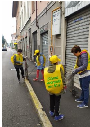
Figura 15 - Plogging in via Cavallotti