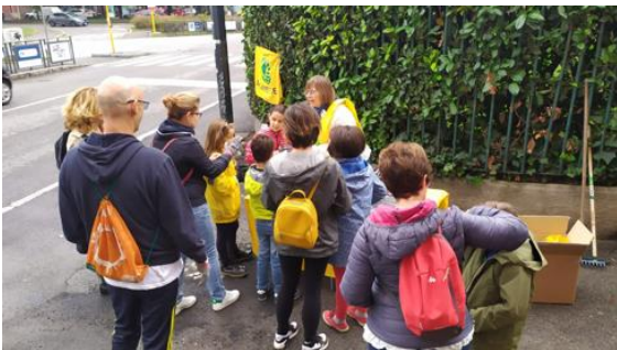
Figura 14 - Preparativi a Triante

Pomeriggio di pulizie richiesto dalla Consulta di Triante e finanziato dal Comune, attraverso la Cooperativa Meta. Obiettivo pulire una vecchia strada vicinale che si dirama dalla piazza Giovanni XXIII a Triante e fare un po' di plogging nelle strade del quartiere (una decina di persone, nonostante la pioggia del mattino e circa 30 kg di rifiuti raccolti, oltre ai soliti mozziconi)