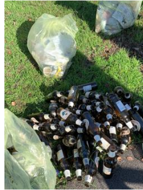
Figura 18 - Bottiglie e bottiglie di vetro