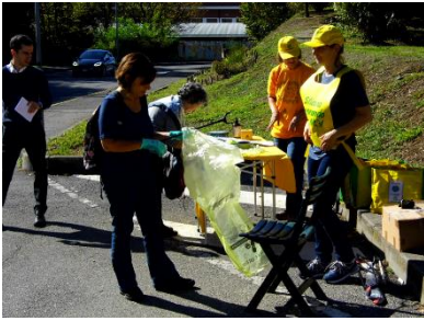
Figura 11 - San Fruttuoso al Montagnone